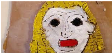
Masque antique créé lors d'un atelier à Vorgium (Carhaix)

Je vais reporter ce travail à l'an prochain.